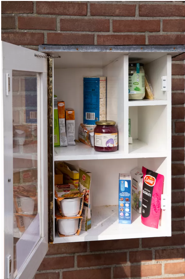
Op het kastje achter de kerk in Woubrugge staat: 'Pak wat je nodig hebt, geef wat je kunt missen'.

Honderden van zulke buurtkastjes – of deeltastjes – hangen verspreid door het hele land. Er liggen voornamelijk levensmiddelen in, zoals pasta, rijst en broodbeleg, maar omwonenden kunnen ook maandverband en tampons delen. De feestdagen bepalen grotendeels de inhoud: na Pasen eindigen veel overgebleven paasstollen in de kastjes. Op steeds meer plekken duiken inmiddels ook buurtkoelkasten op, waarin men pakken melk of versbereide maaltijden kwijt kan aan anderen die het minder breed hebben.